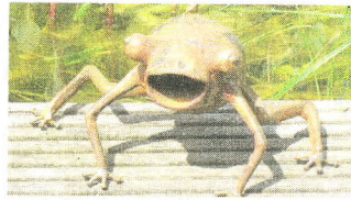
Froschkönig am Teichrand.

Am Eingang schaut aus treuem Sattelfedergesicht ein lang-drahtiger Bobtail empor. Vom Ansitz aus wacht ein Heugabelgeier über das Reich des Rostes, in dem Libellen mit Lochblechflügeln und Fluginsekten mit Schuhlöffelantrieb das Sagen haben. rro